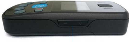
Lautstärkereglern / Hoch / Runter