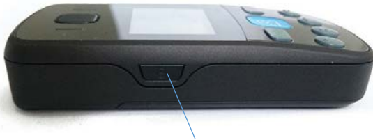
Ein-/Ausschalter / Tastensperre